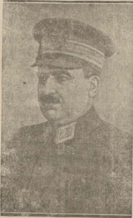
Müşir Fevzi Paşa Hz.

Istanbul, 24 "Hususî", Harbiye mektebi bu sene yüz yaşına giriyor. 30 Ağustosta yüzüncü yıl dönümünü kutlama